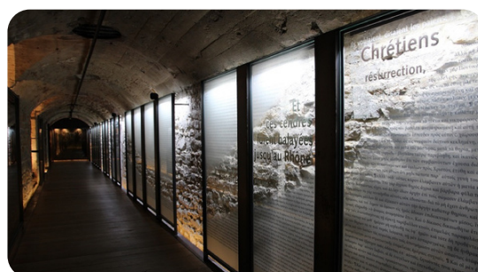
Couloir sonore avec panneaux lumineux

Une fois par mois des conférences sont proposées dans le cadre des Jeudis de l'Antiquaille