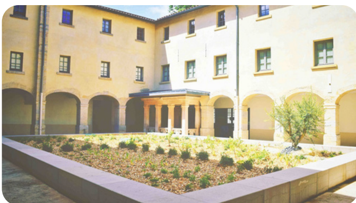
Le cloître des Visitandines (été 2019)

Il complète la riche proposition culturelle de la colline de Fourvière marquée par les origines gallo-romaines de Lyon (Lugdunum - musée et théâtres romains, du temple, des aqueducs, des voies romaines...) par un ensemble culturel, dédié à l'histoire du christianisme (catholicisme, orthodoxie, protestantisme). A proximité de la basilique et du Musée d'Art Religieux de Fourvière, à quelques pas de la maison de Lorette, cet espace permet la conservation et la mise en valeur d'un site classé aux Monuments Historiques, tout en proposant un lieu de découverte et d'expositions temporaires au public.