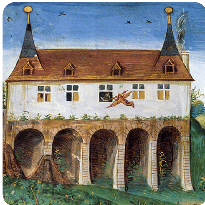
L'Anticaille, Maison de Pierre Sala en 1505.