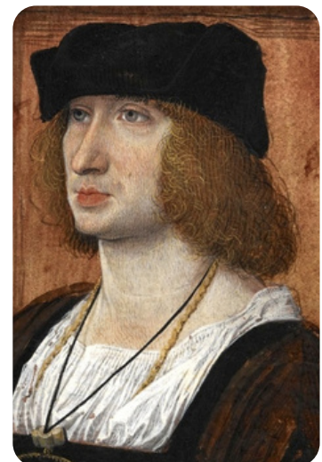
L'humaniste Pierre Sala

XVIIe siècle : Les Visitandines font construire une chapelle et un cloître. Elles découvrent une cavité souterraine sous le cloître, dont elles pensent qu'il s'agit du lieu où auraient été détenus les chrétiens. Il n'y aucune confirmation historique de cette hypothèse.