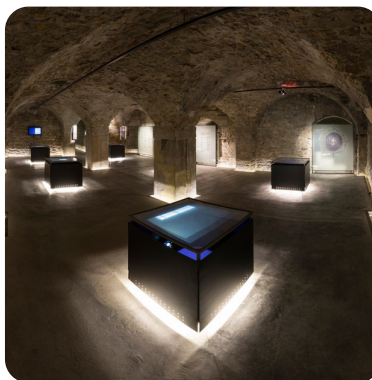
Salle voûtée sur les fondements du christianisme avec des tables lumineuses

L'espace de 900m 2 a été réhabilité par l'architecte lyonnais Pierre Vurpas et le parcours de 15 salles, scénographié par Piotr Zaborski.